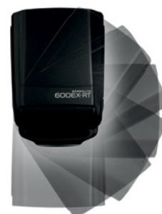
Speedlite 600EX-RT Schwenk nach rechts