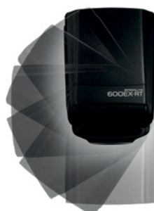
Speedlite 600EX-RT Schwenk nach links