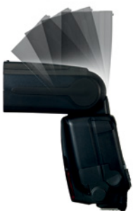
Speedlite 600EX-RT Schwenk nach oben

Nutzt man ein Blitzlicht als primäre Lichtquelle, kann das Umgebungslicht im Hintergrund über eine Belichtungskorrektur in der Kamera reduziert werden. In den Belichtungsmodi Manuell, Av oder Tv wird Ihre EOS sowohl das Tageslicht, als auch die E-TTL II Blitzmessung berücksichtigt.