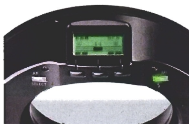
Hochwertiges DOT-Matrix Display

Hinzu kommt ein genau so übersichtliches wie ansprechendes DOT-Matrix Display, welches die Bedienung des mecablitz 15 MS-1 digital zusätzlich vereinfacht.