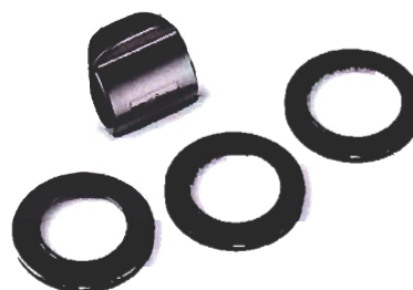
Eine Infrarot-Klammer und drei Adapterringe für 52, 55 und 58 mm sind genau so im Lieferumfang enthalten, wie eine Bouncerscheibe für weichen Lichtcharakter.

Bei Digitalkameras der Marken Canon, Nikon, Olympus/Panasonic, Pentax/Samsung und Sony-Alpha kann der komfortable Remote-TTL-Blitzbetrieb des mecablitz 15 MS-1 digital genutzt werden. Wobei die Kamera entweder mit einem als Master fungierenden, eingebauten Blitzgerät ausgestattet sein muss oder mit einem als Master fungierenden Zusatzblitz (z.B. Metz 58 AF-1 digital) ausgestattet sein muss.