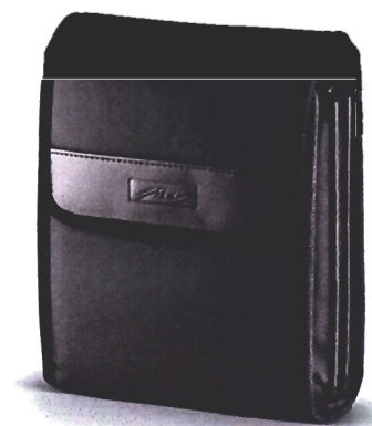
Auch eine praktische, formschöne Gürteltasche ist bereits im Lieferumfang des Metz mecablitz 15 MS-1 digital enthalten.

Optional sind Adapterringe in den Größen 62, 67 und 72 mm erhältlich.