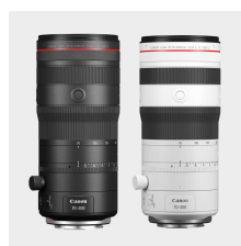
RF 70-200mm F2.8L IS USM Z