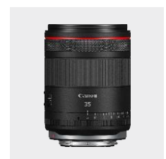
RF 35mm F1.4L VCM