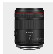
RF 50mm F1.4L VCM